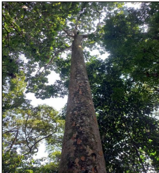
Gambar 4. Khaya anthoteca yang ditemukan di ekosistem Tahura Carita Banten

pembentukan kanopi yang rapat dan efektif. Temuan ini didukung oleh pernyataan Richards (1996) bahwa tumbuhan yang digunakan sebagai penutup kanopi hutan harus memenuhi berbagai kriteria penting untuk memastikan mereka berfungsi secara efektif dalam membentuk dan mempertahankan struktur kanopi. Pertama, tumbuhan tersebut harus dapat tumbuh mencapai ketinggian minimal sekitar 10-15 meter atau lebih, dengan tajuk yang menyebar secara luas dan merata untuk menciptakan lapisan kanopi yang padat dan menyeluruh. Kecepatan pertumbuhan juga menjadi faktor krusial dimana tumbuhan harus memiliki laju pertumbuhan yang cepat agar dapat mencapai ukuran yang diperlukan dalam waktu yang relatif singkat. Selain itu, fleksibilitas dalam menghadapi kondisi lingkungan yang berbeda juga menjadi faktor yang tidak kalah penting. Faktor lain seperti ketahanan terhadap gangguan lingkungan, seperti angin kencang, kekeringan, dan serangan hama, juga merupakan faktor penting untuk menjaga integritas struktur kanopi dan memastikan kelangsungan hidup tumbuhan di ekosistem hutan. Dengan memenuhi kriteria-kriteria ini, tumbuhan dapat berfungsi secara optimal sebagai penutup kanopi, berkontribusi pada struktur dan fungsi ekosistem hutan secara keseluruhan.