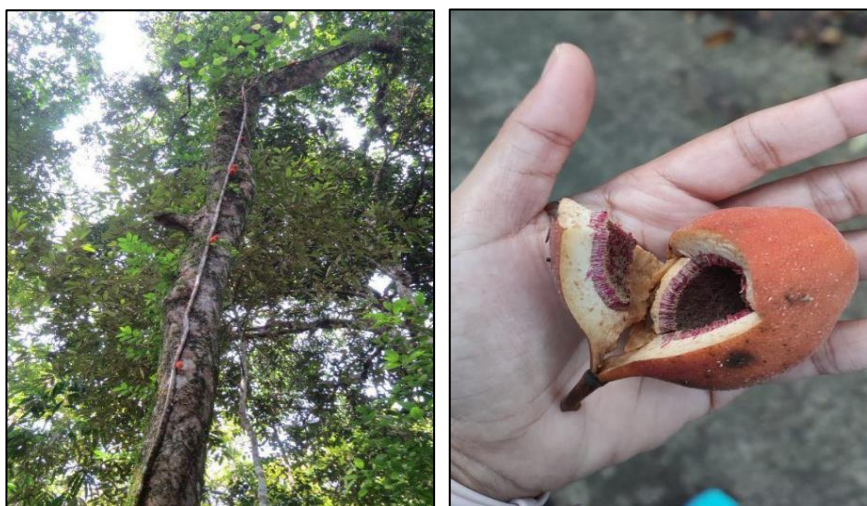
Gambar 2. Ficus punctata di Ekosistem Tahura Carita Banten (a) Habitus; (b) Buah

Salah satu jenis tumbuhan memanjat ( liana ) yang menonjol dan berbeda dari spesies liana lainnya yang ditemukan di Tahura Carita Banten adalah Ficus punctata Thunb. (Moraceae). Tumbuhan ini memiliki karakteristik unik, yaitu hidup dengan cara memanjat pada tumbuhan lain yang lebih besar dan tinggi untuk mengakses cahaya. Daun Ficus punctata berbentuk oval atau bulat telur dengan ujung tumpul atau meruncing. Batangnya cenderung ramping dan menempel pada permukaan tumbuhan inang dengan arah memanjang secara vertikal, sering kali berwarna cokelat muda hingga keabu-abuan. Keunikan lain dari Ficus punctata terletak pada buahnya, yang berwarna oranye terang dan berukuran relatif besar. Buah ini tumbuh dalam jumlah yang tidak banyak (2-5 buah) dan menempel di sepanjang batang atau cabang utama, tepatnya pada bagian yang sebelumnya menjadi tempat berkembangnya bunga-bunga (lihat Gambar 1).