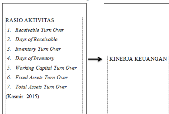
Gambar 2 Kerangka Penelitian

Untuk mempermudah pemahaman terhadap permasalahan yang akan dihadapi maka perlu dirumuskan dalam bentuk skematis. Hal ini untuk memberikan arah dari peneliti. Adapun kerangka analisis tersebut adalah sebagai berikut.